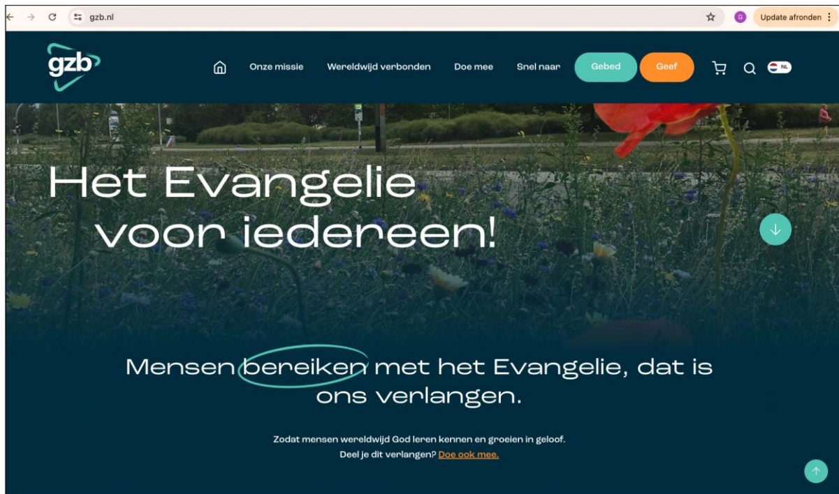
Fig. 2 De homepage van de Gereformeerde Zendingbond (27 juni 2024).