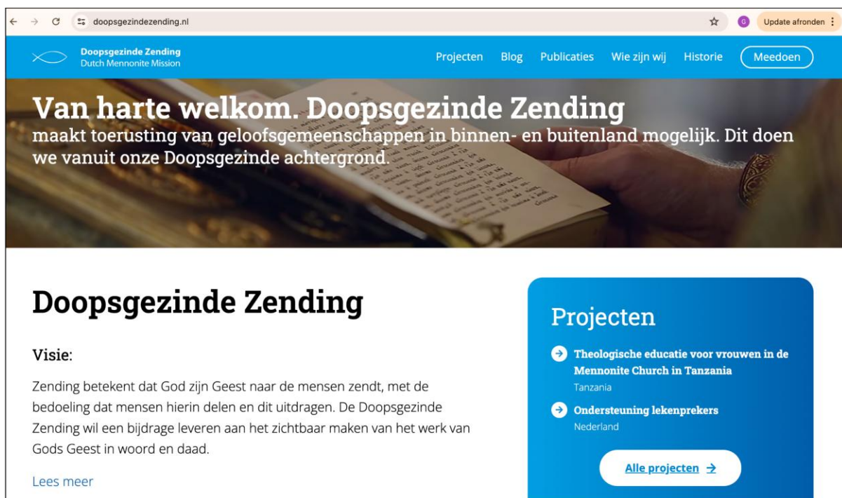
Fi. 3 De homepage van de Doopsgezinde Zending (27 juni 2024).

Wanneer je verder zoekt op de websites zie je uiteraard meer uitleg over de projecten die ze doen en komt ook de ontwikkelingssamenwerking meer naar voren. Het beeld op de websites